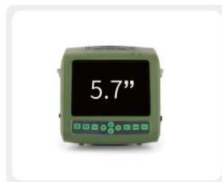
5.7"高解析度液晶顯示器